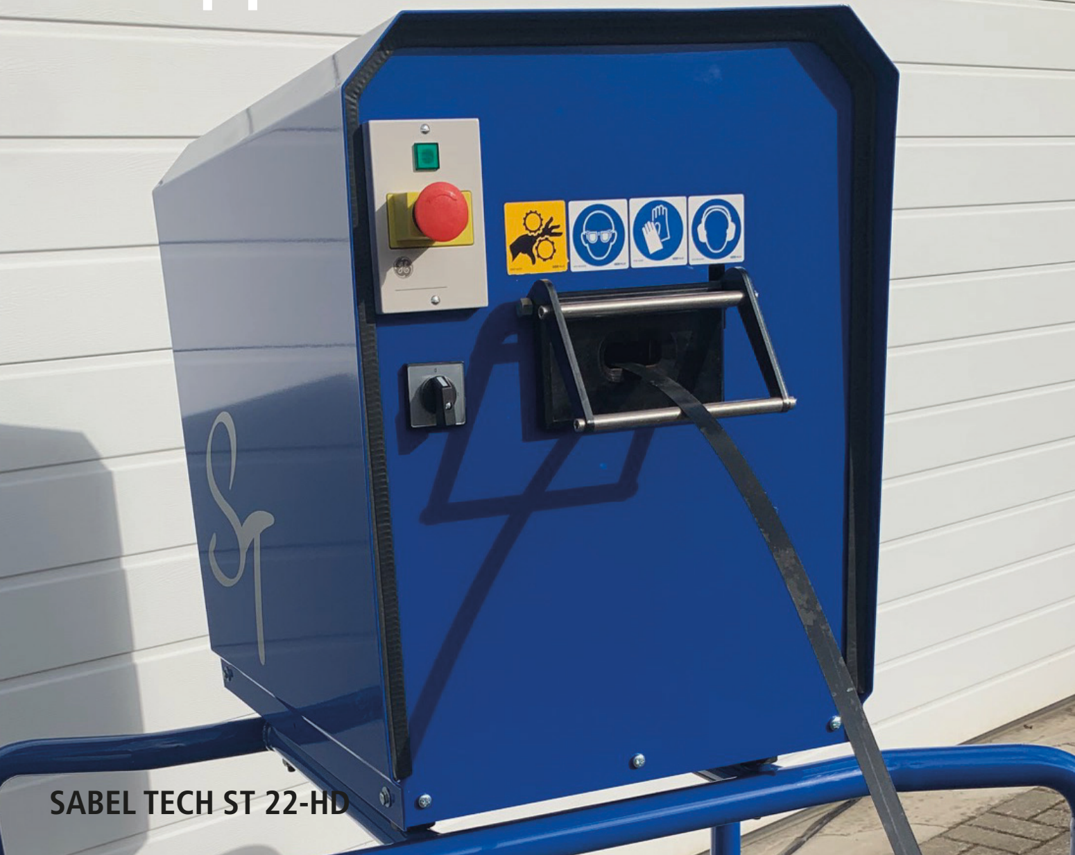
SABEL TECH ST 22-HD